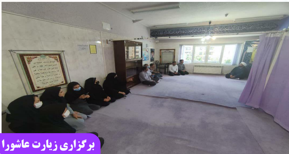
برگزاری زیارت عاشورا

بانوان در امور سازمان می‌توانند نقش مهمی برای بهبود و ارتقای جایگاه سازمان ایفا کنند.