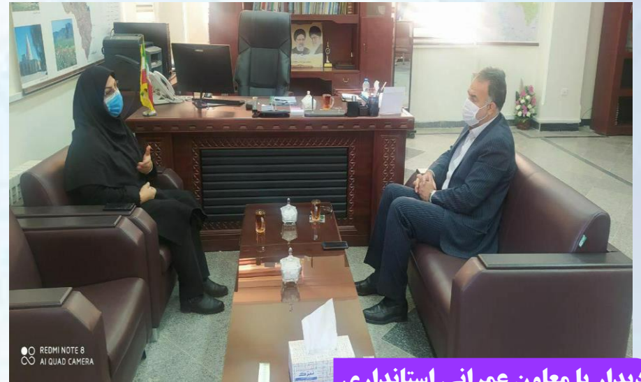
دیدار با معاون عمرانی استانداری