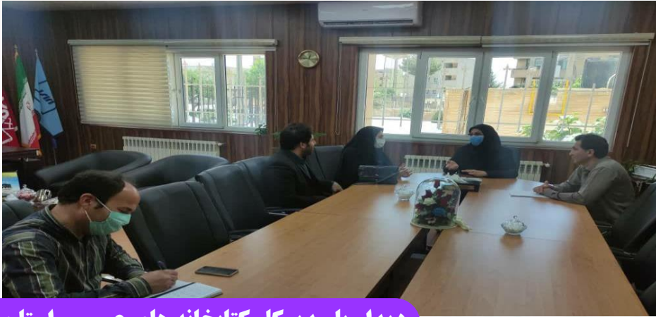
دیدار با مدیر کل کتابخانه های عمومی استان

با اراده و همت مدیران گام دوم انقلاب و مردمی، ثابت کردیم که خواستن توانستن است.