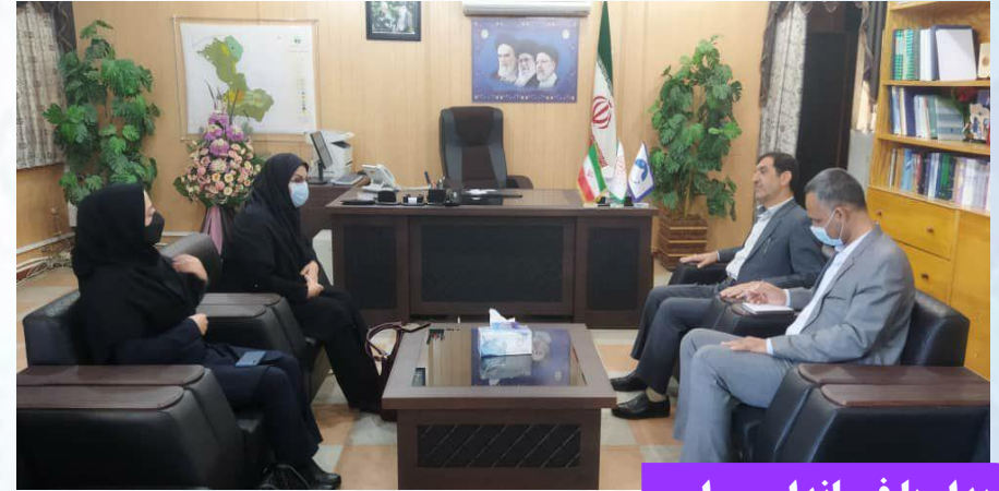
دیدار با فرماندار مهران