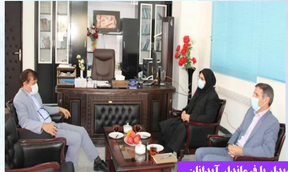
دیدار با فرماندار آبدانان