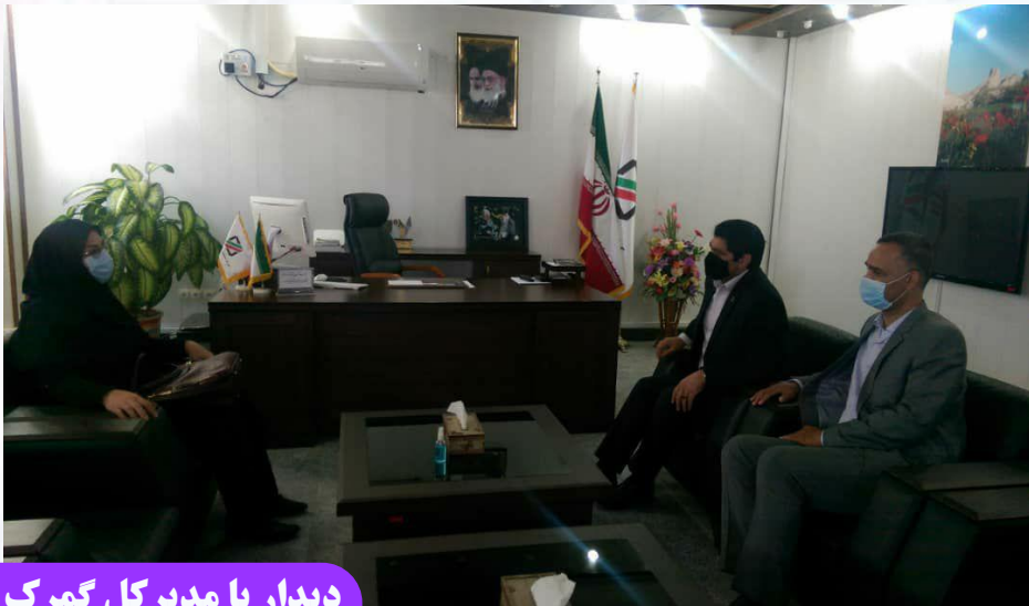
دیدار با مدیر کل گمرک