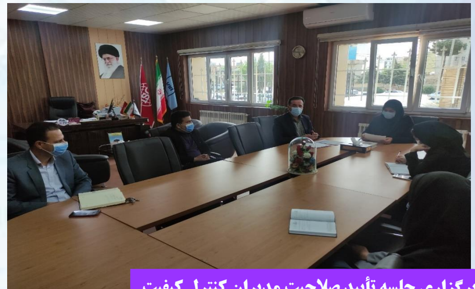
برگزاری جلسه تأیید صلاحیت مدیران کنترل کیفیت