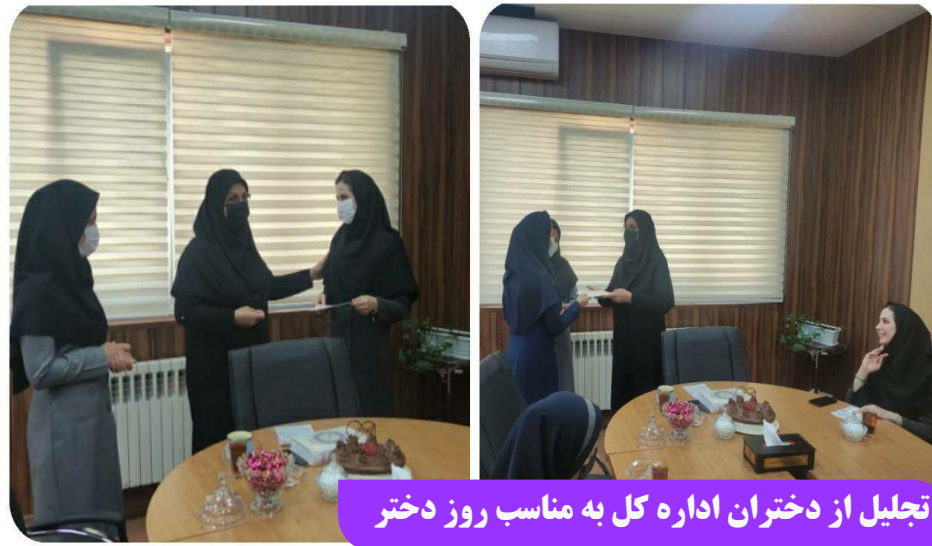
تجلیل از دختران اداره کل به مناسب روز دختر