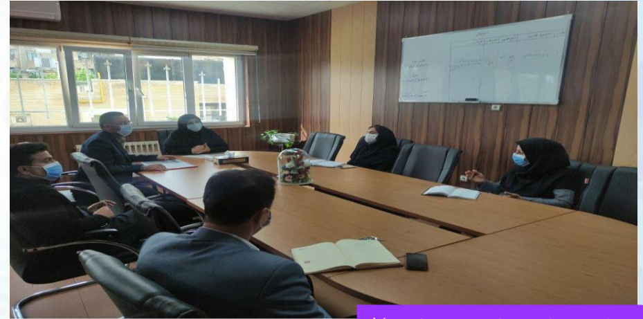
برگزاری جلسه کارگروه ماده ۷