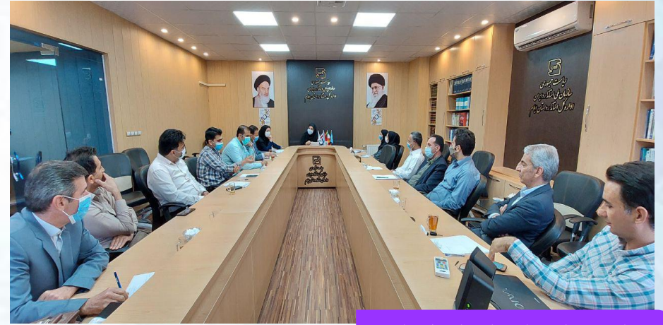
برگزاری جلسه اجرای استاندارد