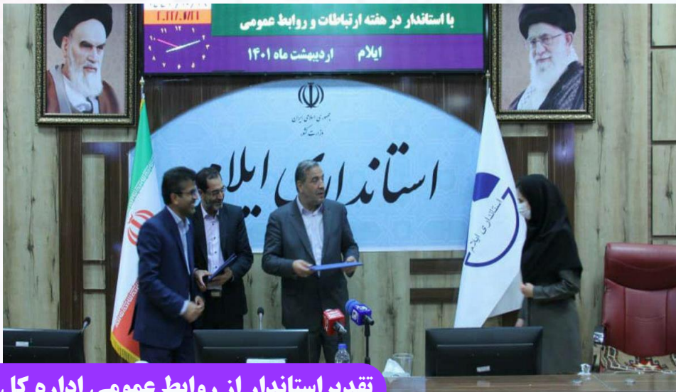
تقدیر استاندار از روابط عمومی اداره کل