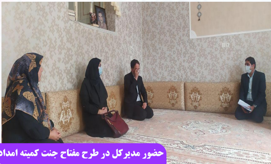
حضور مدیرکل در طرح افتتاح جنت کمیته امداد