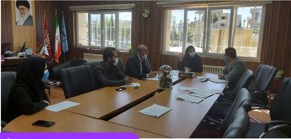
برگزاری جلسه کمیسیون ماده ۴۲

توسعه خودروهای برقی و زیرساخت‌های حمل و نقل برقی مورد حمایت ویژه سازمان ملی استاندارد است.