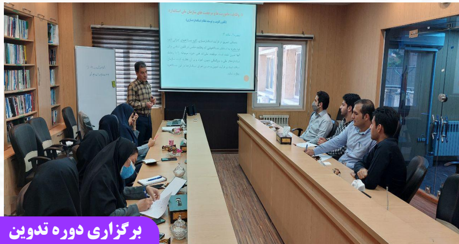
برگزاری دوره تدوین

ما خود را وکیل مردم میدانیم چون در جای مردم نشستیم و باید حق مطالبه مردم را رعایت کنیم.