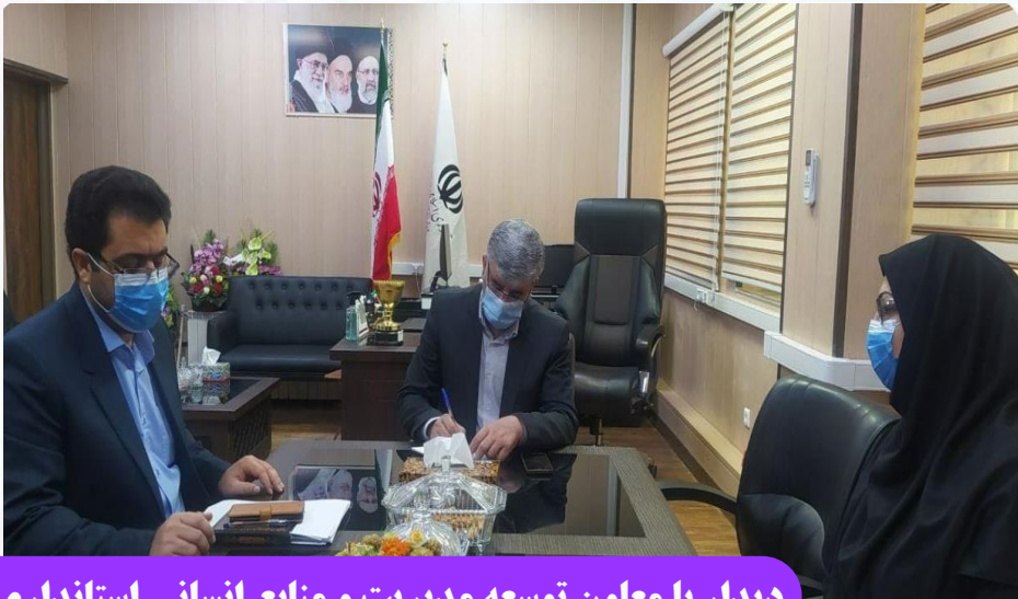
دیدار با معاون توسعه مدیریت و منابع انسانی استانداری