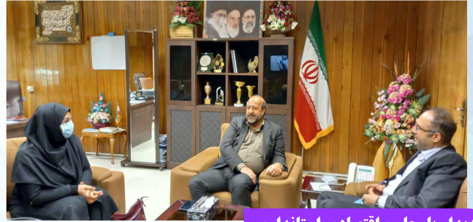
دیدار با معاون اقتصادی استانداری