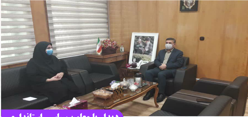
دیدار با معاون سیاسی استانداری

مدیران سازمان ملی استاندارد ایران می توانند با نظارت استصوابی در جهت تقویت اعتماد مردم گام بردارند.