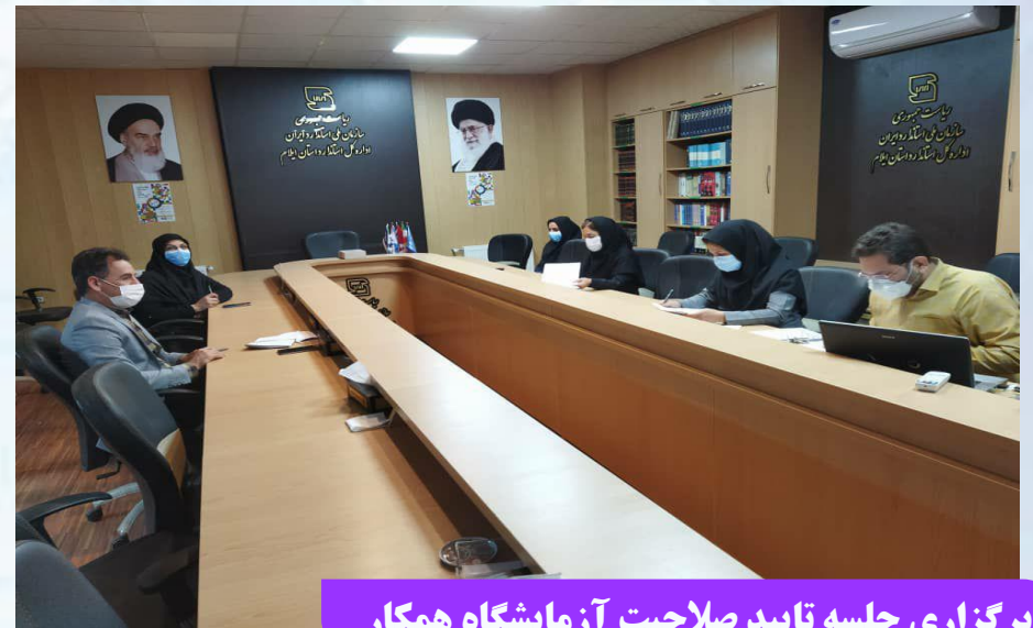
برگزاری جلسه تایید صلاحیت آزمایشگاه همکار