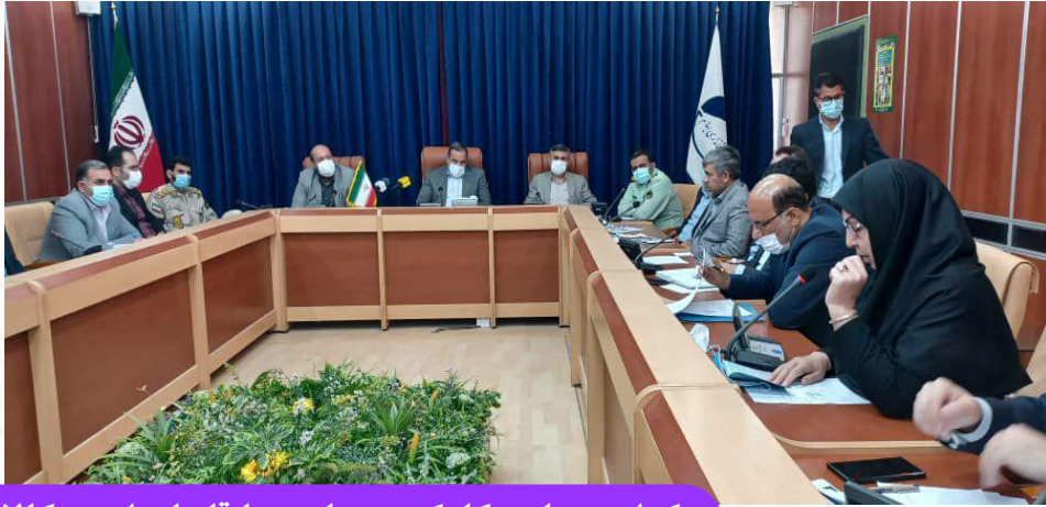
برگزاری جلسه کارگروه مبارزه با قاچاق ارز و کالا

مرکز ملی تأیید صلاحیت ایران، مجموعه ای است که باید با چابک سازی، پایداری و ارتقای شفافیت، راهبرد علمی را در اولویت قرار دهد.